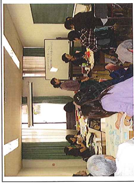
子育て分科会の様子