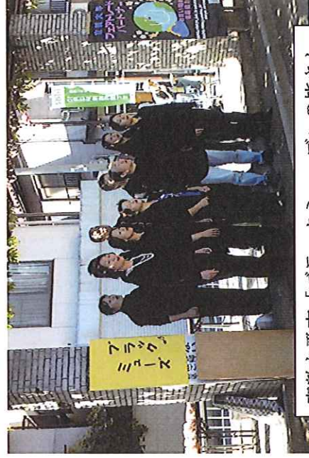
素敵な歌声「ブラックミュージク」の皆さん

ブラックMの皆さん、本当に素敵な歌声有難うございました。今後よろしくお願い致します！