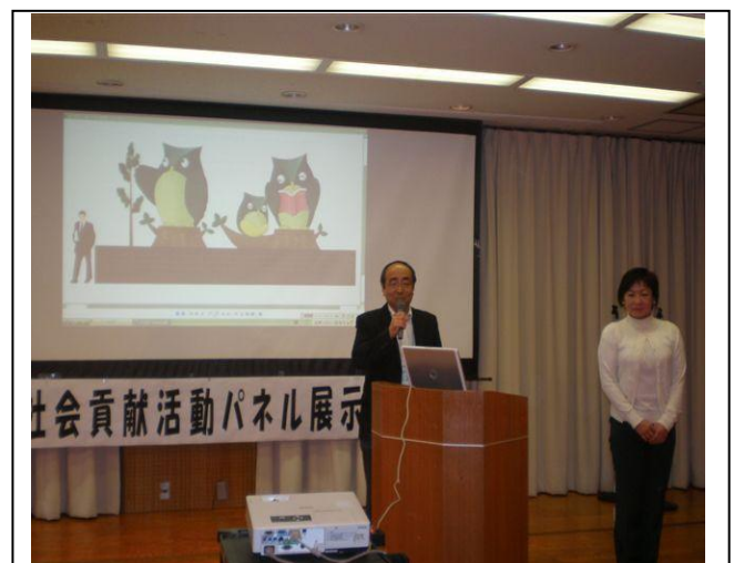
「モザイカルチャー」ミニ・セミナーの様子