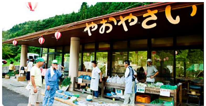
イベントでの、さいはらで採れた野菜の販売風景

一方、活動のなかで課題もありました。例えば、特定できる地域ブランド（特産品）がないことや史跡、伝統芸能といった観光事業の育成や宿泊施設の整備が不十分であること、さらに、平成13年に、都市住民との交流の場として建設された「羽置の里 びりゅう館」が十分に機能を発揮できていないことなどです。私たちは、これら地域課題を解決するため、NPO法人を立ち上げました。現在は地域ブランドの開発、製造、販売などに取り組み、地域経済の活性化、雇用の創出を目指して活動しています。特産品として開発した、薬味唐辛子、食べるラー油、ゆずジャムは、えんがわ市でも販売されています。また、西原へ多くの観光客に来ていただくため、史跡や伝統芸能などの育成と、体験イベントの企画や宿泊施設の整備もおこなっていきます。