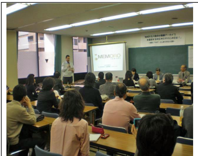
MEMORO シンポジウム会場

来年度も、地域の皆さまにさまざまな団体の活動を知っていただき、相互に交流を深めていただけるよう社会貢献活動見本市を継続していきたいと思います。 (文責：天野)